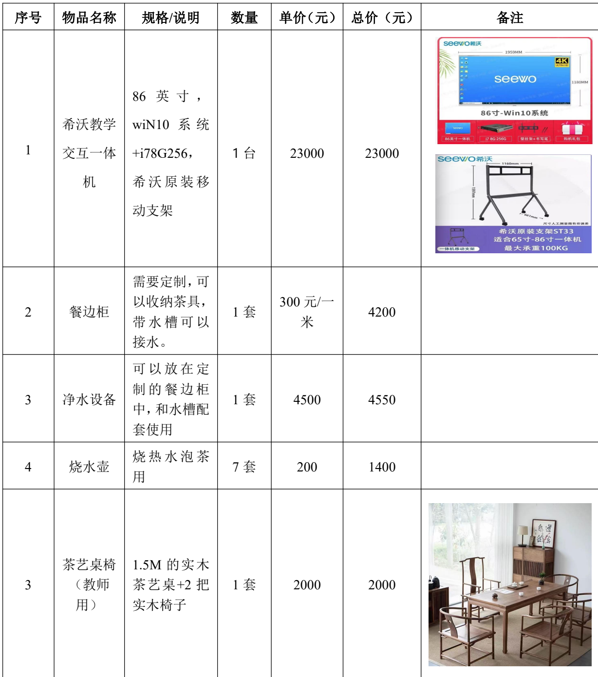
(2) 茶艺实训室硬件设备材预算表